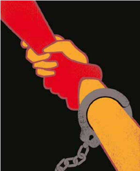
Graphic Design : Cédric Gatillon / HM Studio © 2020

On 10 October 2020, the World Coalition Against the Death Penalty and abolitionist organizations around the world celebrated the 18 th World Day Against the Death Penalty. This year the World Day was dedicated to the right to effective legal representation during all stages of arrest, detention, trial and post-trial – a pillar in the right to a fair trial.