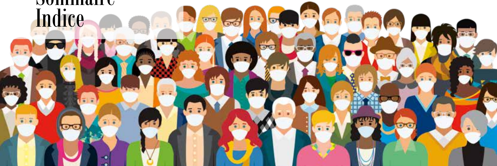
Table of contents | Sommaire | Indice | 2

President's Editorial 3 Éditorial du Président 4 Editorial del Presidente 5 Message from the Editor-in-Chief 7 Message du rédacteur en chef 8 Mensaje del Redactor Jefe 9